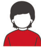
単日試合券 購入希望者

※リセールが成立した際の入金額は、出品料金からリセール申込手数料(出品料金の10%)と送金事務手数料(330円税込)を差し引いた金額となります。