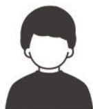
シーズンチケット購入者

行けない試合のチケットをご家族やご友人にワンタッチパスマイページから無償で譲渡することができるサービスです。